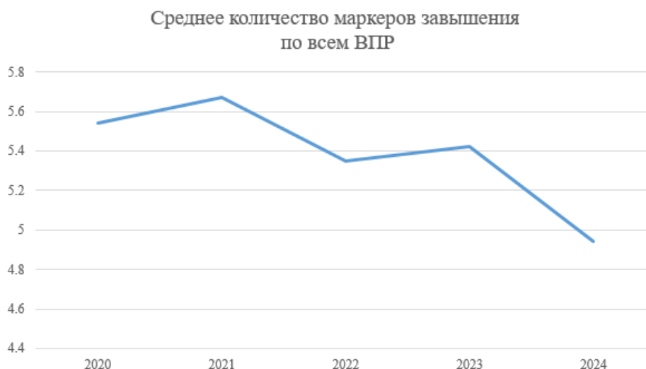
Рис. 2. Динамика среднего количества маркеров завышения, 2020-2024 гг.

Как следует из данных в табл. 9, более 60% образовательных организаций имеют хотя бы по одной ВПР маркер завышения результатов. В некоторых школах сразу несколько десятков ВПР в год имеют данный маркер. Заметим, что количество ОО с маркерами необъективности только по русскому языку и математике в 4-х и 5-х классах за 2024 год в сравнении с 2023 годом значительно уменьшилось, а количество ОО с маркерами по всем параллелям и учебным предметам практически не изменилось. Это может свидетельствовать о том, что образовательные организации в обеспечении объективности значительно больше акцентируют внимание на тех ВПР, по которым рассчитываются маркеры необъективности ФИОКО. Таким образом, для изучения динамики данного маркера представляется полезным показатель среднего количества маркеров на одну образовательную организацию. На рис. 2 представлен график данного показателя по годам.